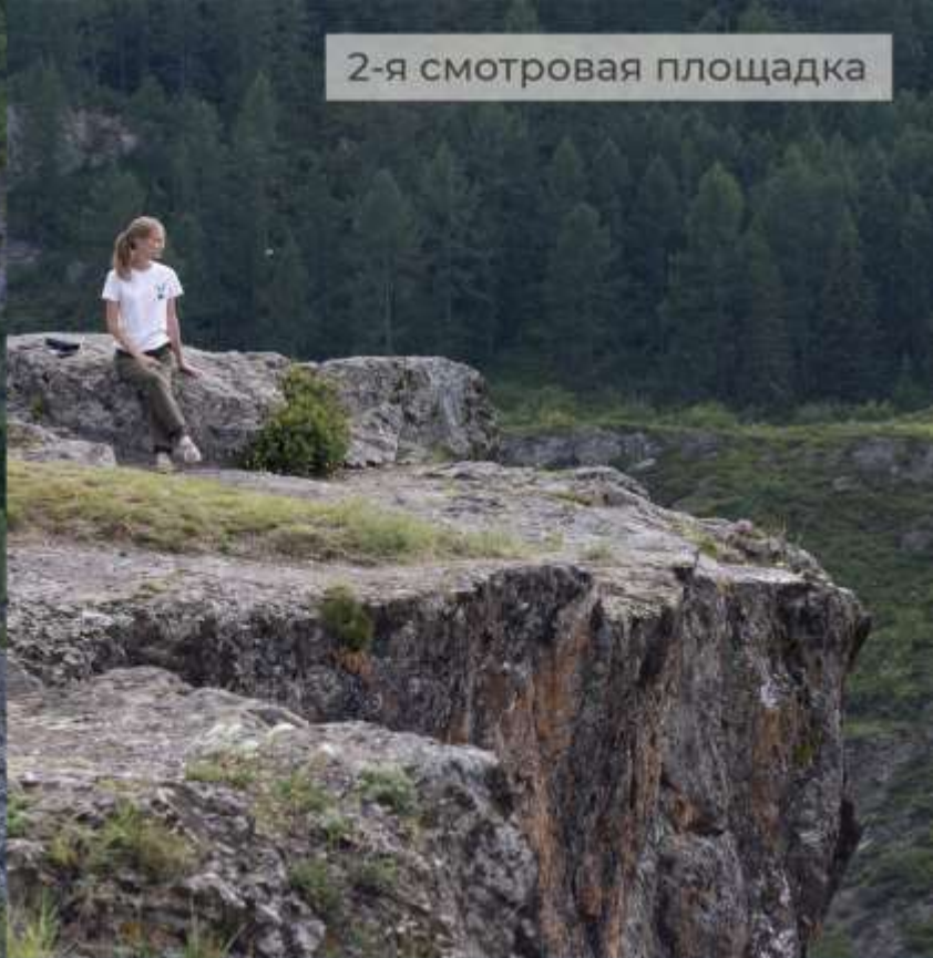
2-я смотровая площадка