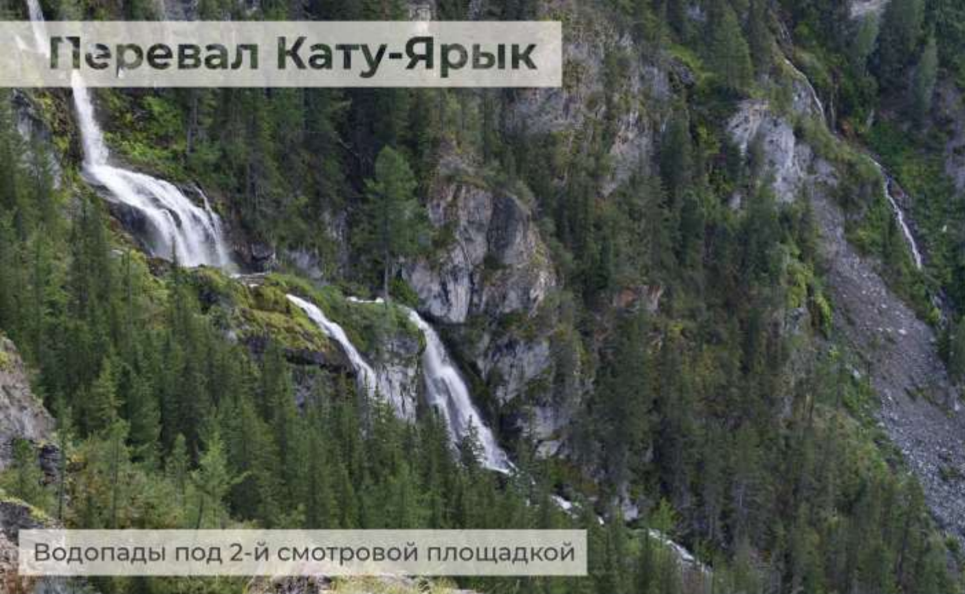
Водопады под 2-й смотровой площадкой