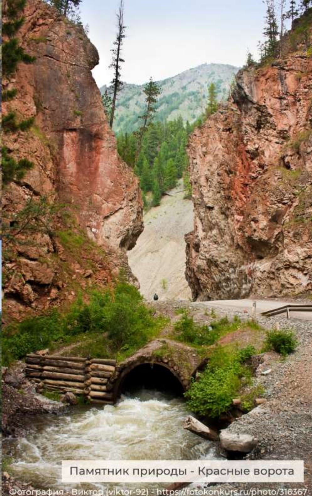
Памятник природы - Красные ворота