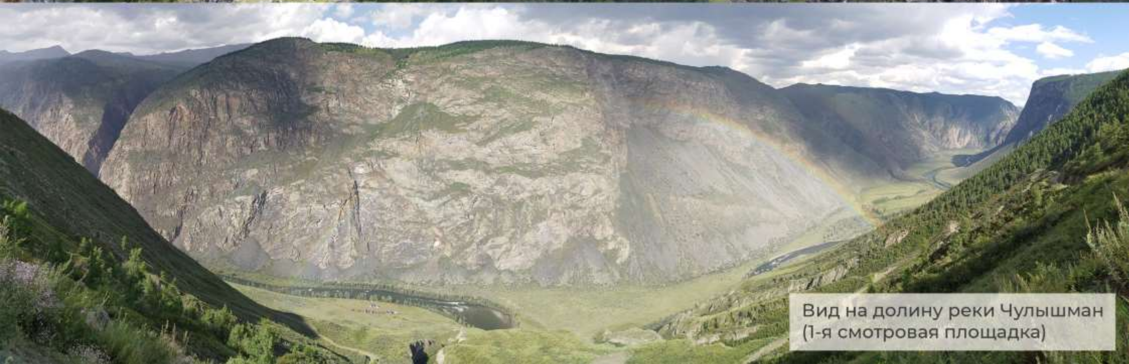
Вид на долину реки Чулышман (1-я смотровая площадка)